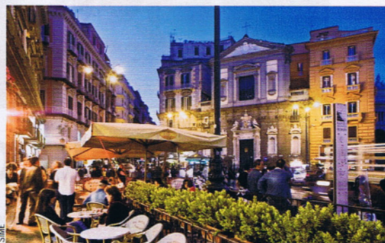
Napoli (sopra piazza Trieste e Trento) a maggio è ricca di appuntamenti con degustazioni di vino (a sinistra) e tour di shopping (sotto).